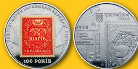
우표 발행 100주년 100 YEARS OF UKRAINE'S FIRST POSTAGE STAMPS 5 hryvnias, 2018