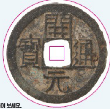
주화 꾸러미를 만들어 보세요.

한국은행 화폐박물관 기획전 BANK OF KOREA MONEY MUSEUM SPECIAL EXHIBITION