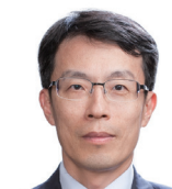
부총재보 이환석 (2020년 3월 9일~)