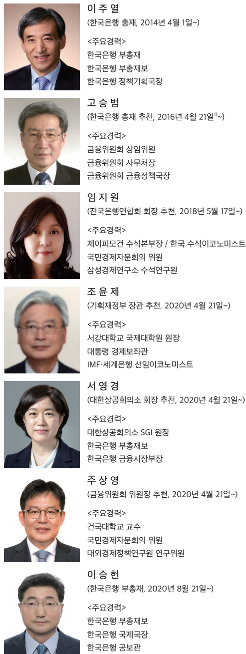
그림 1 - 3. 금융통화위원회 위원 명단 (2020년 12월 31일 현재)

주: 1) 금융위원회 위원장 추천으로 임명되어 4년 임기(2016년 4월 21일~2020년 4월 20일)를 마친 후, 2020년 4월 21일 한국은행 총재 추천으로 연임됨(임기 3년)