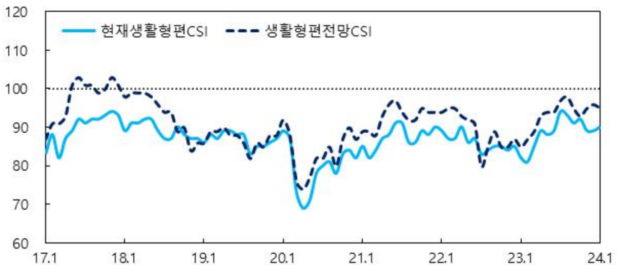
생활형편 관련 CSI

주 : 1) 6개월 전과 비교한 현재 2) 현재와 비교한 6개월 후 전망