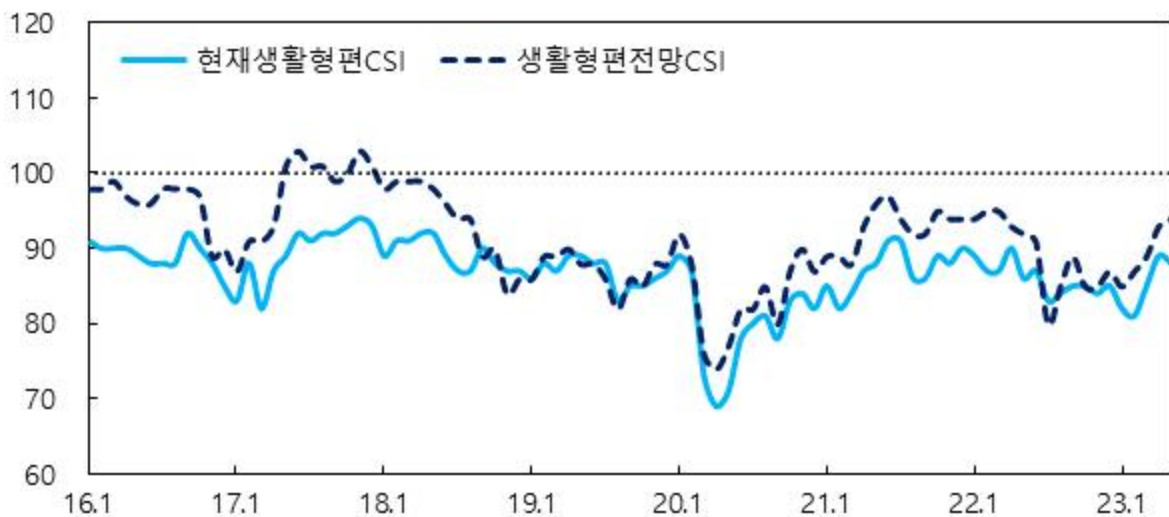
생활형편 관련 CSI

주 : 1) 6개월 전과 비교한 현재 2) 현재와 비교한 6개월 후 전망