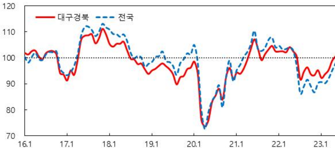
소비자심리지수 1) 추이

주 : 1) 2003.1~2022.12월중 장기평균치를 기준값 100으로 하여 100보다 크면 장기평균보다 낙관적임을, 100보다 작으면 비관적임을 의미 2) 2022.7월부터 실태본을 대상으로 한 조사결과임