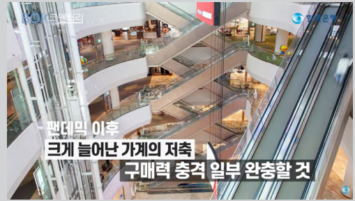
그림 II - 34. 유튜브 「BOK코멘터리」

또한 블로그 게시물 중 일부를 국민들의 영상 콘텐츠 수요를 충족시키기 위해 5분 내외 길이의 영상(「BOK코멘터리」)으로도 제작해 한국은행 홈페이지와 유튜브 채널을 통해 제공하고 있다 200) .