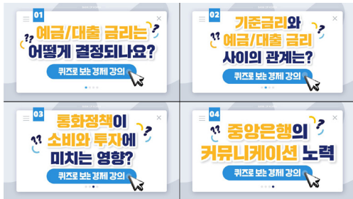
그림 II - 33. 동영상 「퀴즈로 보는 경제강의」

경제·금융 주제 중에 청소년들이 꼭 알아야 할 주제 4편을 선정하여 「퀴즈로 보는 경제강의」 동영상 시리즈를 제작하였다. 기준금리, 예금/대출금리, 통화정책이 경제에 미치는 영향, 중앙은행의 커뮤니케이션과 관련하여 학습자들이 영상 내용을 학습한 후 퀴즈를 통해 동 내용을 복습해볼 수 있도록 구성하였다.