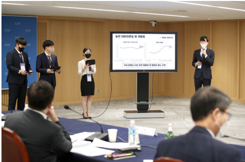
그림 II - 29. 통화정책 경시대회 결선 (2022년 8월 12일)

개최하여 주요 금융경제 현안과 함께 지역별 주 택가격 동향 및 리스크 등 지역경제 현안에 대 한 의견을 학계와 교환하고 한국은행의 정책과 업무에 대한 관심과 이해를 높이는 데 힘썼다.