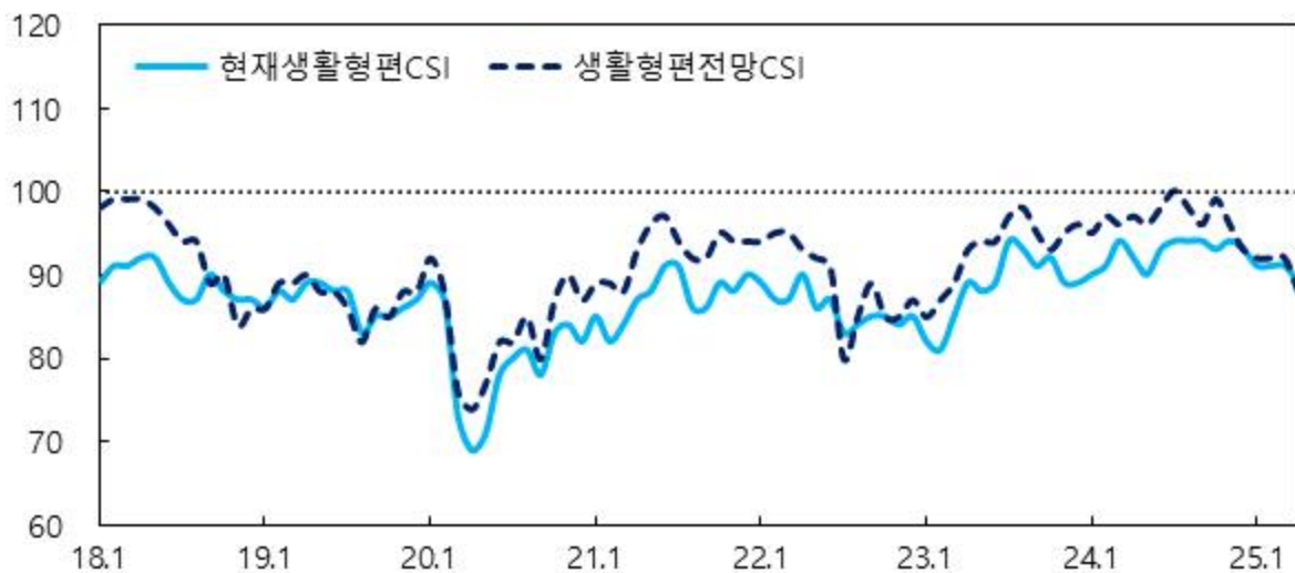
생활형편 관련 CSI

주 : 1) 6개월 전과 비교한 현재 2) 현재와 비교한 6개월 후 전망