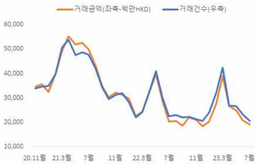
홍콩 주택거래 건수 및 금액 추이