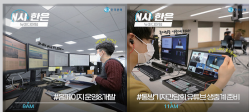
그림 II-31. 인스타그램 「N시 한은」