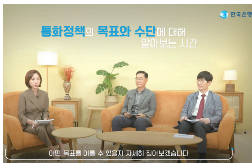
그림 II - 29. 동영상 「풀어서 듣는 경제강의」 1편 「통화정책이란?」