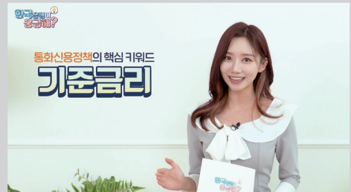
그림 II-32. 유튜브 「한국은행이 궁금해?」