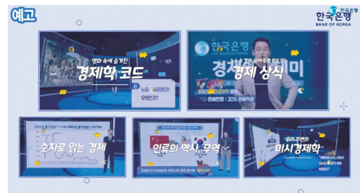
그림 II - 30. 동영상 「한국은행 경제아카데미」 예고편