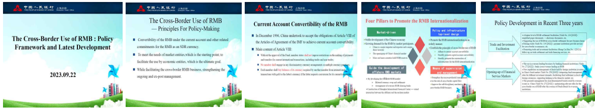
자료 : 인민은행 상해총부

□ 한편 영란은행은 최근에 실시한 영국 대형은행에 대한 스트레스 테스트 현황 및 결과에 대해서, 신개발은행은 설립 배경 및 운영현황에 대해서 각각 발표