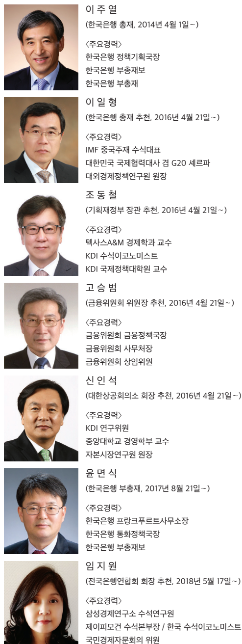
그림 1-3. 금융통화위원회 위원 명단 (2019년 12월 31일 현재)

금융통화위원회는 기준금리 결정, 한국은행권 발행, 여수신정책, 공개시장운영, 지급결제, 금융기관 검사 등 통화신용정책에 관한 사항은