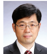
부총재보 유 상 대 (2018년 5월 15일~)