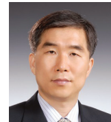
부총재보 정 규 일 (2018년 5월 15일~)