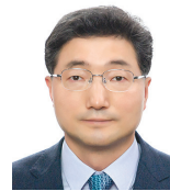
부총재보 이 승 현 (2019년 6월 4일~)