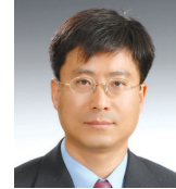
부총재보 박 중 석 (2019년 7월 25일~)