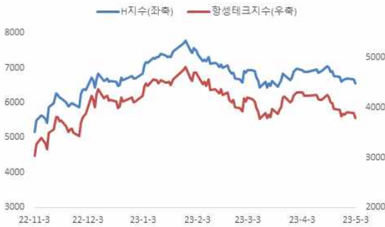
최근 H지수 및 항생테크지수