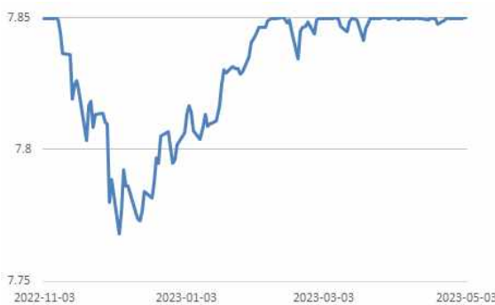
홍콩달러 환율 추이