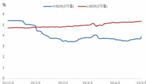
LIBOR 및 HIBOR 금리 추이(3개월물 기준)