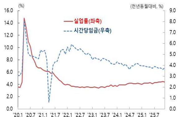
실업률 및 시간당 평균임금 상승률