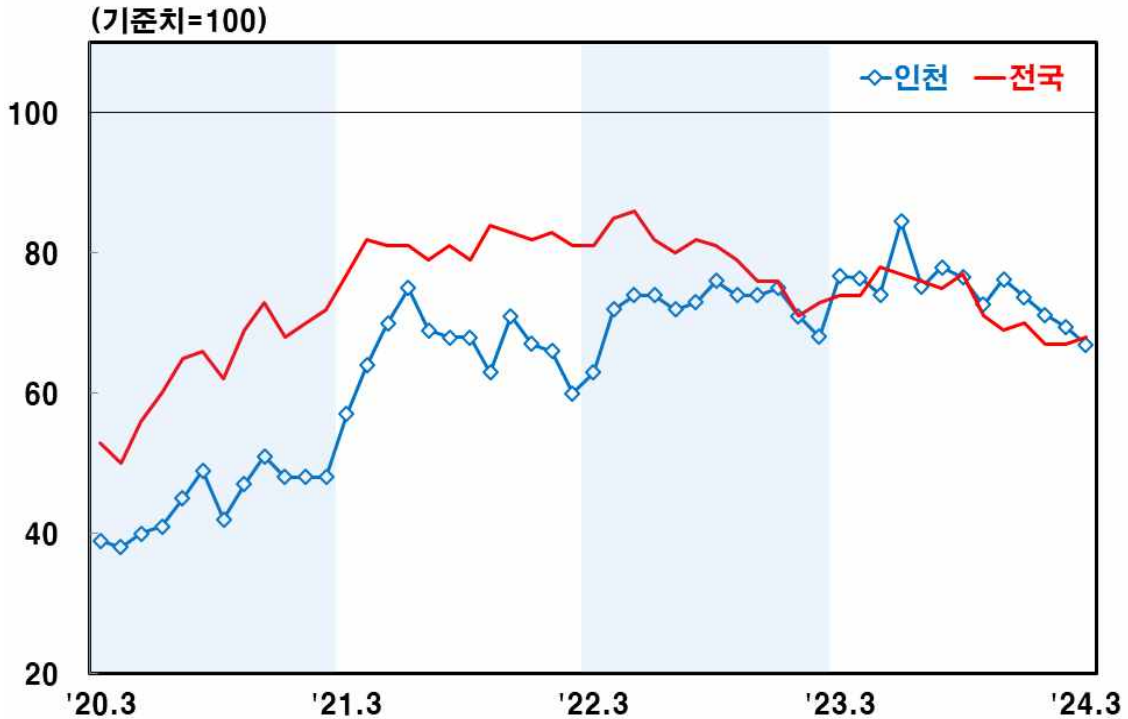
인천지역 비제조업 업황BSI 1)

주: 1) 「좋음」 응답업체 구성비(%) - 「나쁨」 응답업체 구성비(%) + 100