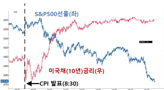
미국채금리(10y) 및 주가(S&P500 선물) 일중 변동