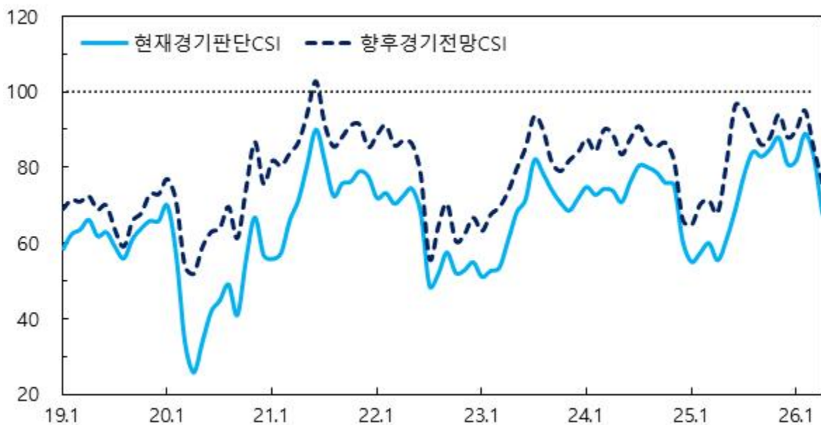
경기 관련 CSI

주 : 1) 6개월 전과 비교한 현재 2) 현재와 비교한 6개월 후 전망