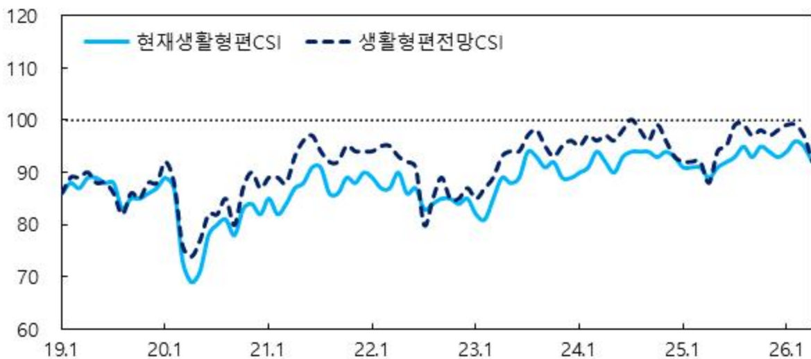
생활형편 관련 CSI

주 : 1) 6개월 전과 비교한 현재 2) 현재와 비교한 6개월 후 전망