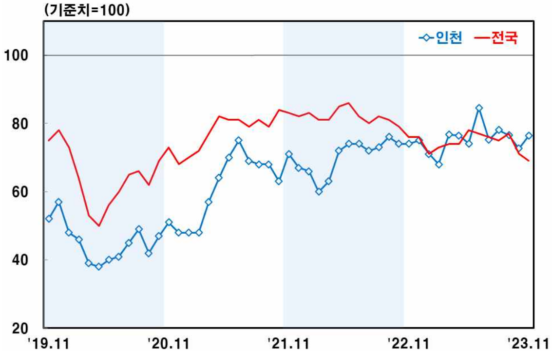
인천지역 비제조업 업황BSI 1)

주: 1) 「좋음」 응답업체 구성비(%) - 「나쁨」 응답업체 구성비(%) + 100