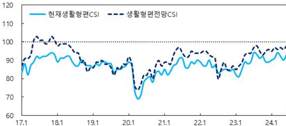
생활형편 관련 CSI

주 : 1) 6개월 전과 비교한 현재 2) 현재와 비교한 6개월 후 전망