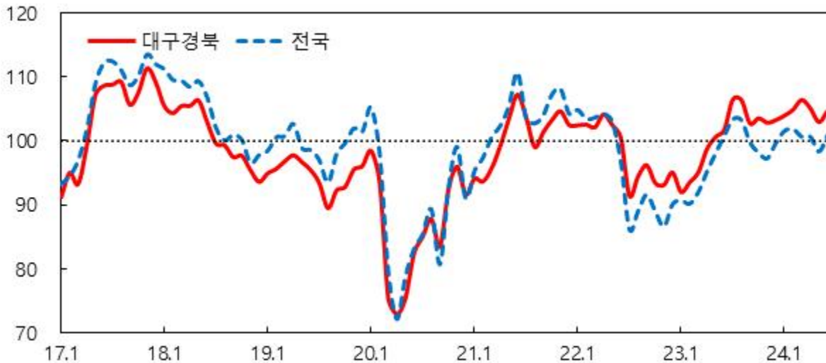
소비자심리지수 1) 추이

주 : 1) 2003~2023년중 장기평균치를 기준값 100으로 하여 100보다 크면 장기평균보다 낙관적임을, 100보다 작으면 비관적임을 의미 2) 2022.7월부터 신표본을 대상으로 한 조사결과임