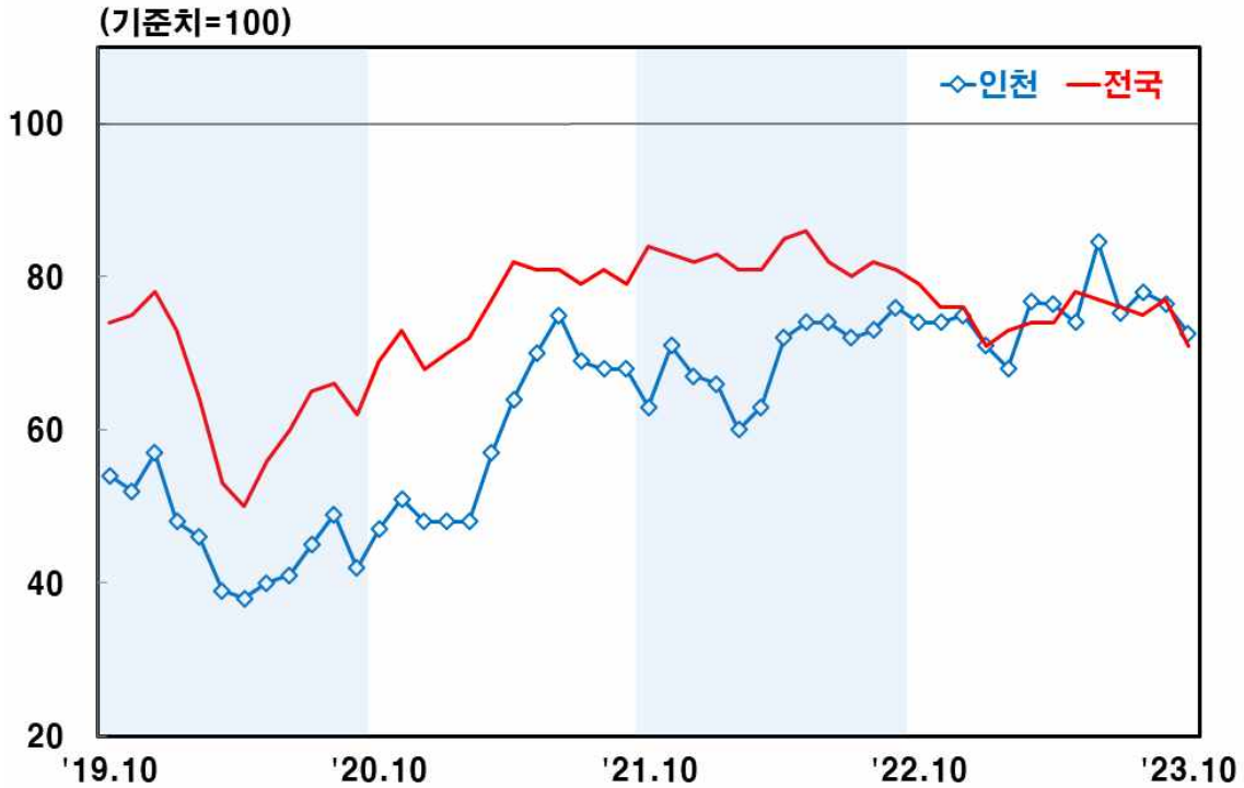
인천지역 비제조업 업황BSI 1)

주: 1) 「좋음」 응답업체 구성비(%) - 「나쁨」 응답업체 구성비(%) + 100