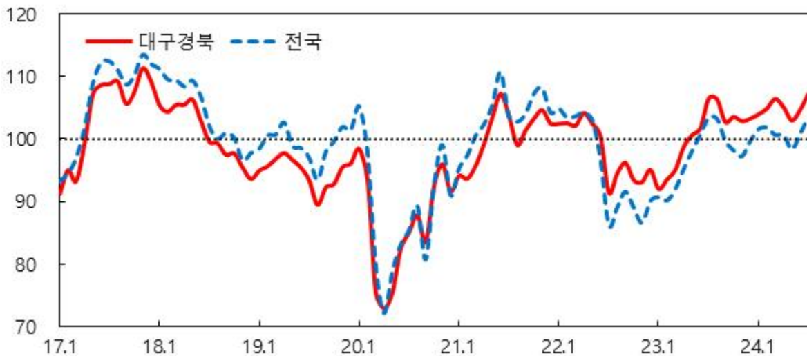
소비자심리지수 1) 추이

주 : 1) 2003~2023년중 장기평균치를 기준값 100으로 하여 100보다 크면 장기평균보다 낙관적임을, 100보다 작으면 비관적임을 의미 2) 2022.7월부터 신표본을 대상으로 한 조사결과임