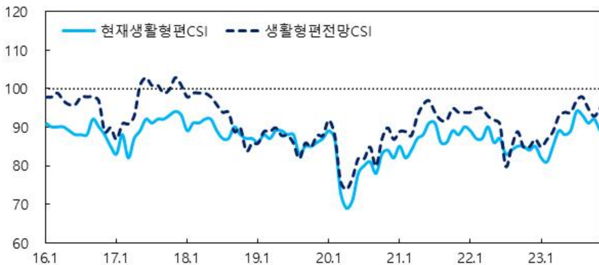
생활형편 관련 CSI

주 : 1) 6개월 전과 비교한 현재 2) 현재와 비교한 6개월 후 전망