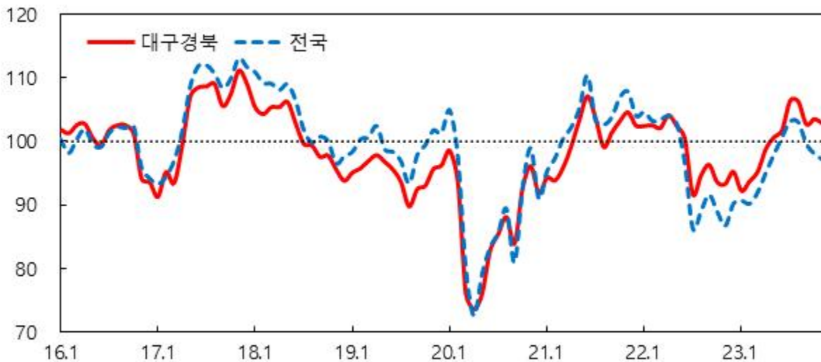
소비자심리지수 1) 추이

주 : 1) 2003.1~2022.12월중 장기평균치를 기준값 100으로 하여 100보다 크면 장기평균보다 낙관적임을, 100보다 작으면 비관적임을 의미 2) 2022.7월부터 신표본을 대상으로 한 조사결과임